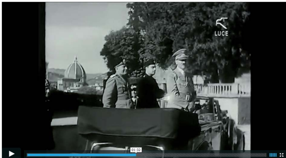
Fig. 9. Documentario Luce, D031201, Il viaggio del Fuhrer in Italia , still da video, < https://vimeo.com/63181236 >