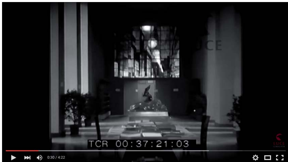
Fig. 4: Giornale Luce A0710, 01/1931, Roma. S. E. il Capo del Governo assiste alla “Vernice” della prima Quadriennale d’Arte Nazionale , still da video, < https://www.youtube.com/watch?v=yc7VTw3Grmk >, 09.08.2016