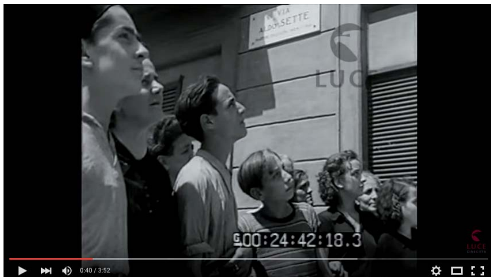
Fig. 10. Giornale Luce C0372, 01/09/1943, Milano dopo gli ultimi terroristici bombardamenti , still da video, < https://www.youtube.com/watch?v=xQ84S3q-w7k >, 09.08.2016