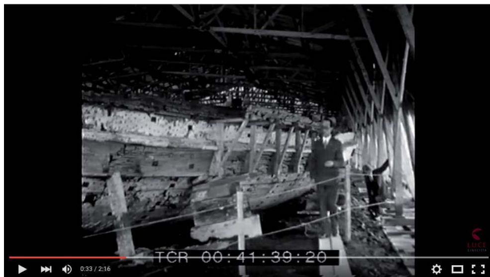
Fig. 5: Giornale Luce A0600, 06/1930, La nave imperiale di Nemi protetta sotto un capannone lungo le rive del lago , still da video, < https://www.youtube.com/watch?v=Az5B0zKkSKY >, 09.08.2016