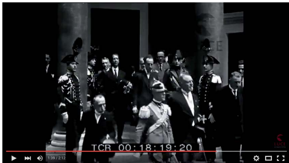
Fig. 3. Giornale Luce A0077, 17/05/1928, Inaugurata la Biennale di Venezia , 35mm film, fotogramma da video mpeg, < https://www.youtube.com/watch?v=CrBxG_VHw94 >, 09.08.2016