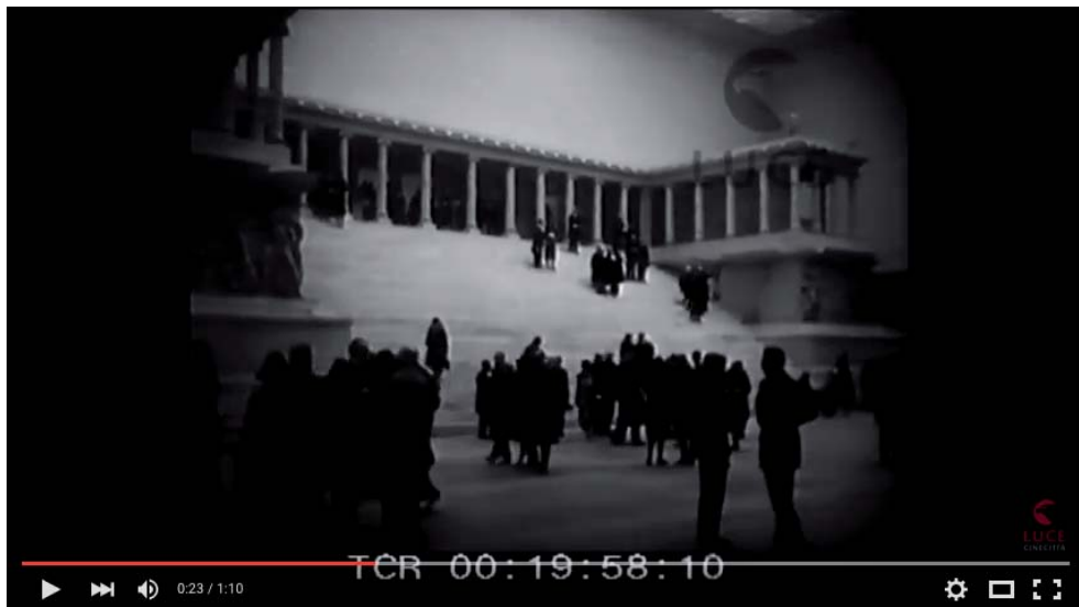
Fig. 8. Giornale Luce A0673, 10/1930, Gli Altari di Pergamos al Museo di Berlino , still da video, < https://www.youtube.com/watch?v=QthomiXFbmk >, 09.08.2016