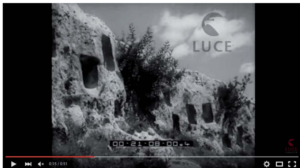
Fig. 7. Giornale Luce B0663, 17/04/1935, La necropoli di Pantalica , still da video, < https://www.youtube.com/watch?v=89UwEkcN-s >, 09.08.2016