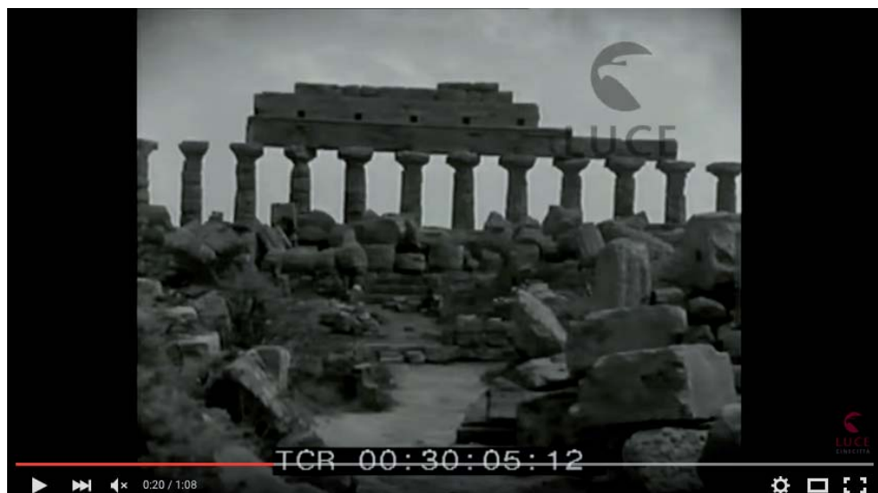
Fig. 6. Giornale Luce A0517, 02/1930, I ruderi greci di Selinunte , still da video, < https://www.youtube.com/watch?v=YITfTGj7tQY >, 24.11.2016