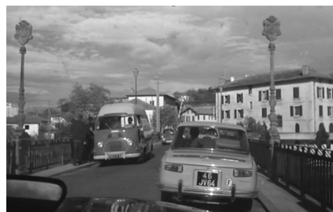
Fig. 4 – La guerra è finita : la panoramica si arresta. Viene inquadrato ciò che il personaggio ha di fronte a sé. La voice-over conclude: «...Ancora una volta, passerai».