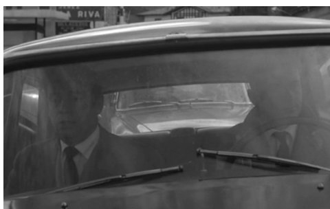
Fig. 1 – La guerra è finita : seconda inquadratura del film. Il protagonista è il personaggio a sinistra.

In questo senso, peraltro, è vero, come ha notato Paolo Giovannetti, che l'effetto di simili passaggi è molto filmico, anche per via del ricorso al tempo presente. La voce che leggendo ci sembra di percepire può ricordare quelle voice-over che al cinema e nella serialità televisiva si sovrappongono alle immagini, commentandole in modo più o meno diretto. Nello specifico, il 'tu' di Se una notte d'inverno un viaggiatore somiglia molto al 'tu' di un film di Alan Resnais, La guerra è finita . Siamo ancora negli anni Sessanta (nel 1966, più precisamente), e sempre in Francia. Nei primi istanti del film, il protagonista è inquadrato frontalmente mentre è seduto in un'automobile, a fianco del guidatore (fig. 1), dopodiché la videocamera, tramite una lenta panoramica, ne asseconda lo sguardo, indugiando sul paesaggio che lo circonda (figg. 2, 3, 4). Nel frattempo, in voice-over ascoltiamo i suoi pensieri: «[c]e l'hai fatta. Ancora una volta contempi la collina di Biriatou, e ritrovi la sensazione un po' amara e leggermente angosciata del passaggio [...]. Il sole si leva dietro di te, sulle alture di Elizondo. Ancora una volta, passerai». 18