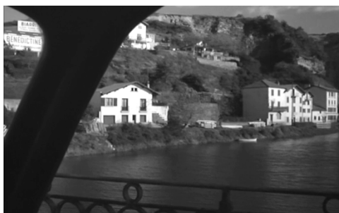
Fig. 3 – La guerra è finita : la panoramica continua a seguire lo sguardo del protagonista, che si sofferma sul paesaggio. In voice-over continuiamo ad ascoltare i suoi pensieri.