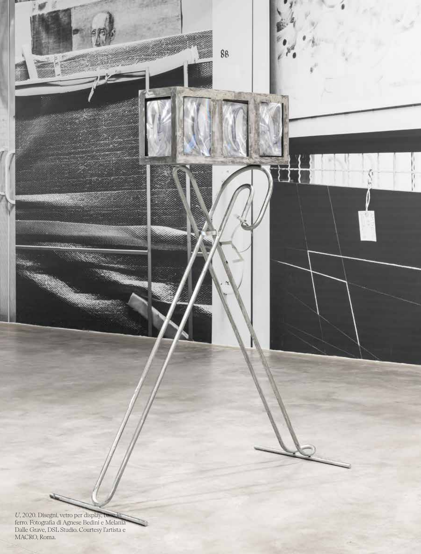
U, 2020. Disegni, vetro per display, base in ferro.