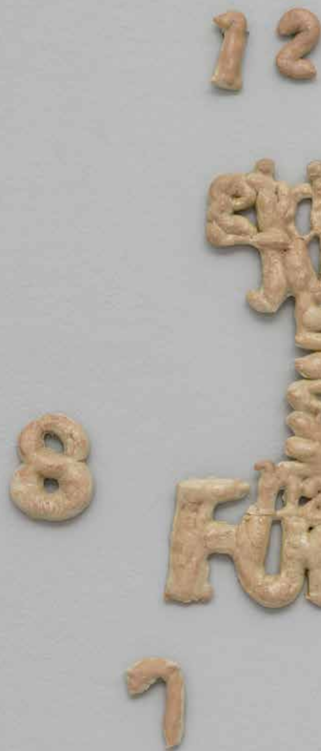
Marx the Girl 5 , 2022. Orologi, pane, fondotinta no. 20 - Ivory. Dimensioni variabili.

Questo transito tra media e linguaggi diversi dà forma a una “plasticità metaletteraria”, come la definisce l'artista, che se da una parte sembra portarsi dietro le tracce delle molteplici narrazioni che l'hanno generata, dall'altra diventa un dispositivo d'indagine capace di decostruire pregiudizi e costrutti di genere.