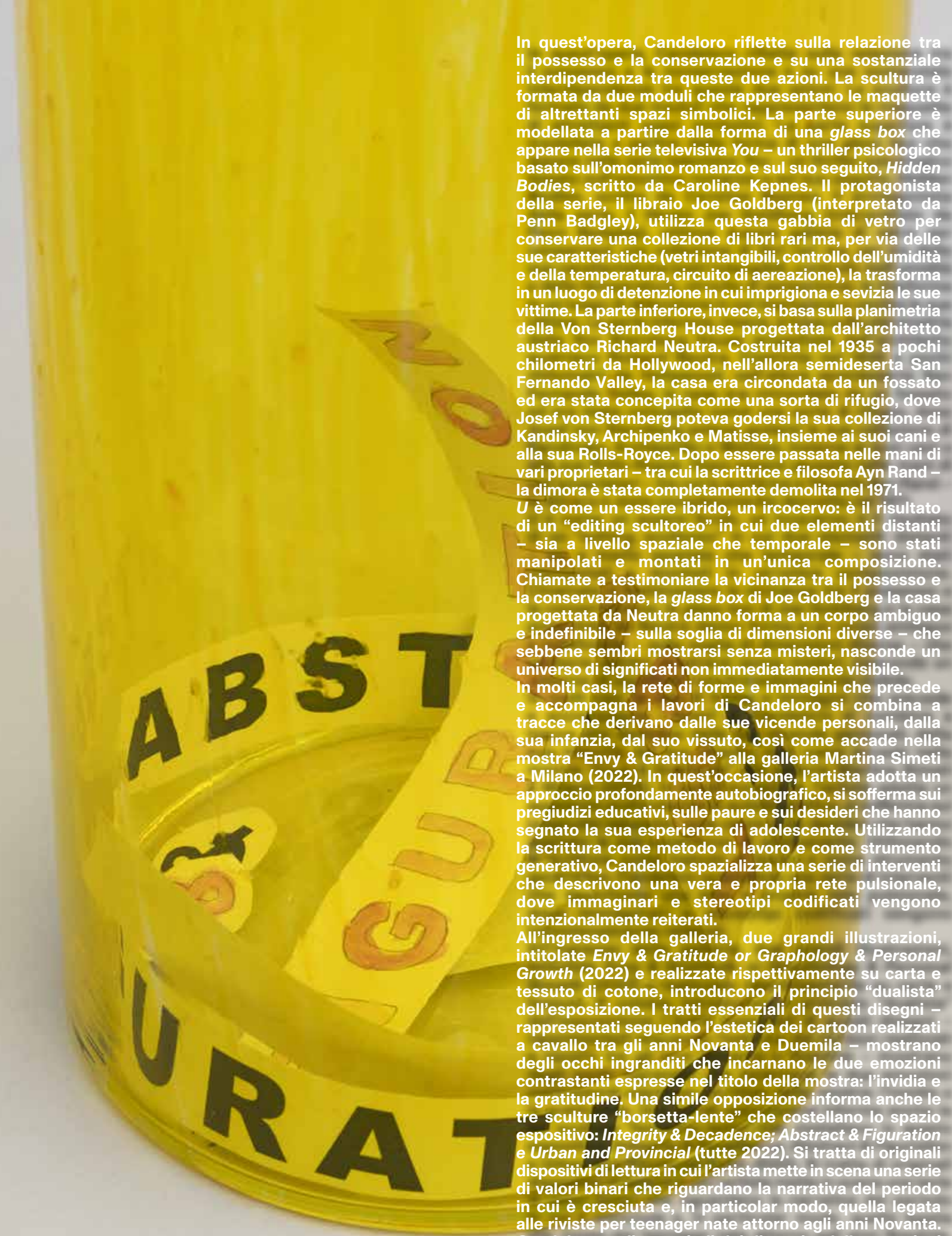
Mains Libres , 2019.

In quest'opera, Candeloro riflette sulla relazione tra il possesso e la conservazione e su una sostanziale interdipendenza tra queste due azioni. La scultura è formata da due moduli che rappresentano le maquette di altrettanti spazi simbolici. La parte superiore è modellata a partire dalla forma di una glass box che appare nella serie televisiva You – un thriller psicologico basato sull'omonimo romanzo e sul suo seguito, Hidden Bodies , scritto da Caroline Kepnes. Il protagonista della serie, il libraio Joe Goldberg (interpretato da Penn Badgley), utilizza questa gabbia di vetro per conservare una collezione di libri rari ma, per via delle sue caratteristiche (vetri intangibili, controllo dell'umidità e della temperatura, circuito di aereazione), la trasforma in un luogo di detenzione in cui imprigiona e sevizia le sue vittime. La parte inferiore, invece, si basa sulla planimetria della Von Sternberg House progettata dall'architetto austriaco Richard Neutra. Costruita nel 1935 a pochi chilometri da Hollywood, nell'allora semideserta San Fernando Valley, la casa era circondata da un fossato ed era stata concepita come una sorta di rifugio, dove Josef von Sternberg poteva godersi la sua collezione di Kandinsky, Archipenko e Matisse, insieme ai suoi cani e alla sua Rolls-Royce. Dopo essere passata nelle mani di vari proprietari – tra cui la scrittrice e filosofa Ayn Rand – la dimora è stata completamente demolita nel 1971.