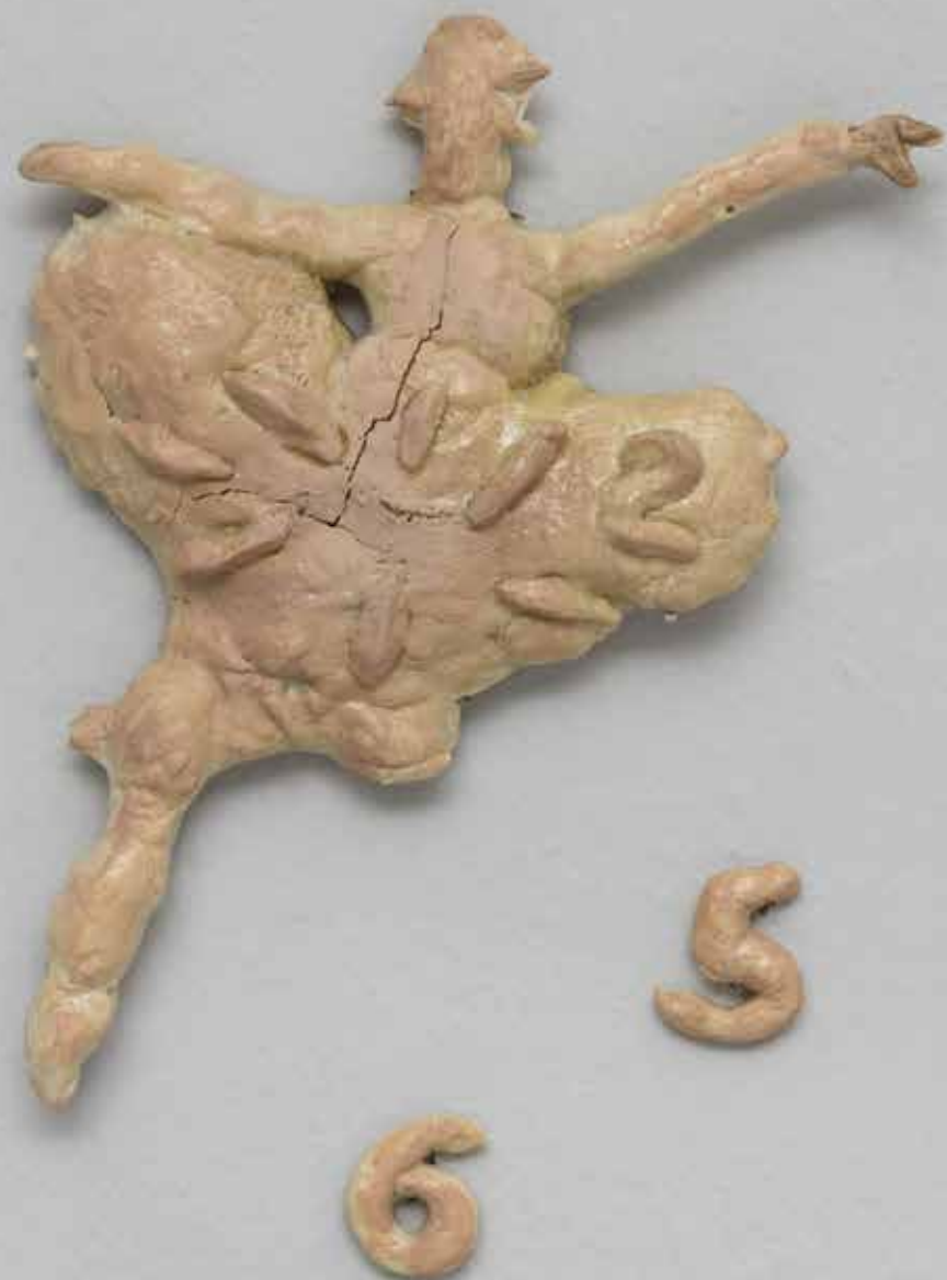
Marx the Girl 4 , 2022. Orologi, pane, fondotinta no. 20 - Ivory. Dimensioni variabili.