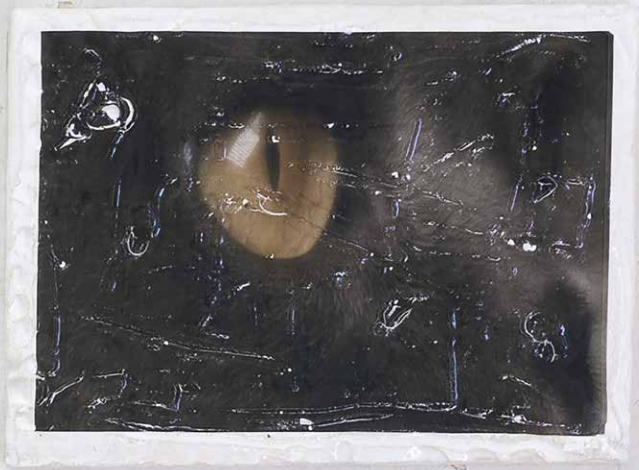
Eye Opulent , 2022. Gres smaltato, decal. 24 × 33 cm. Dettaglio della mostra "MY SKIN-CARE, MY STRENGHT" presso ICA, Milano, 2022.