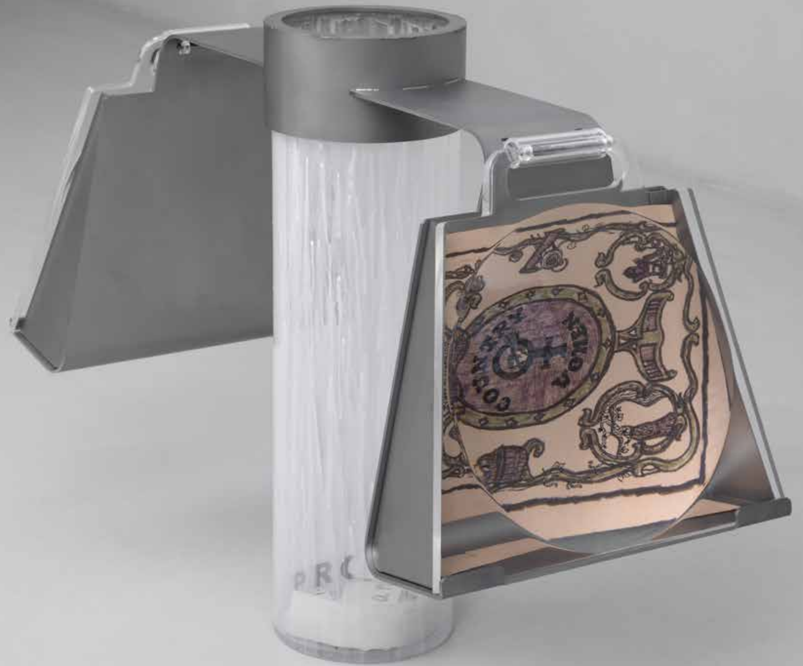
Urban & Provincial , 2022. Struttura in vetro, borse con lente d'ingrandimento, estratto di rivista, disegno. 69,5 × 50 × 30 cm.