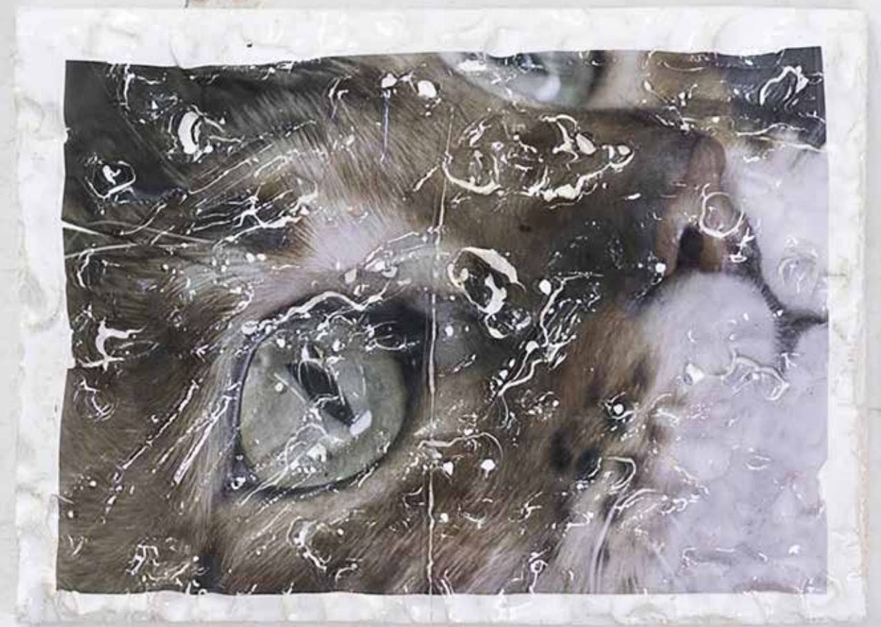
Addicted to the glow , 2022. Gres smaltato, decal. 24 × 33 cm. Dettaglio della mostra "MY SKIN-CARE, MY STRENGHT" presso ICA, Milano, 2022.