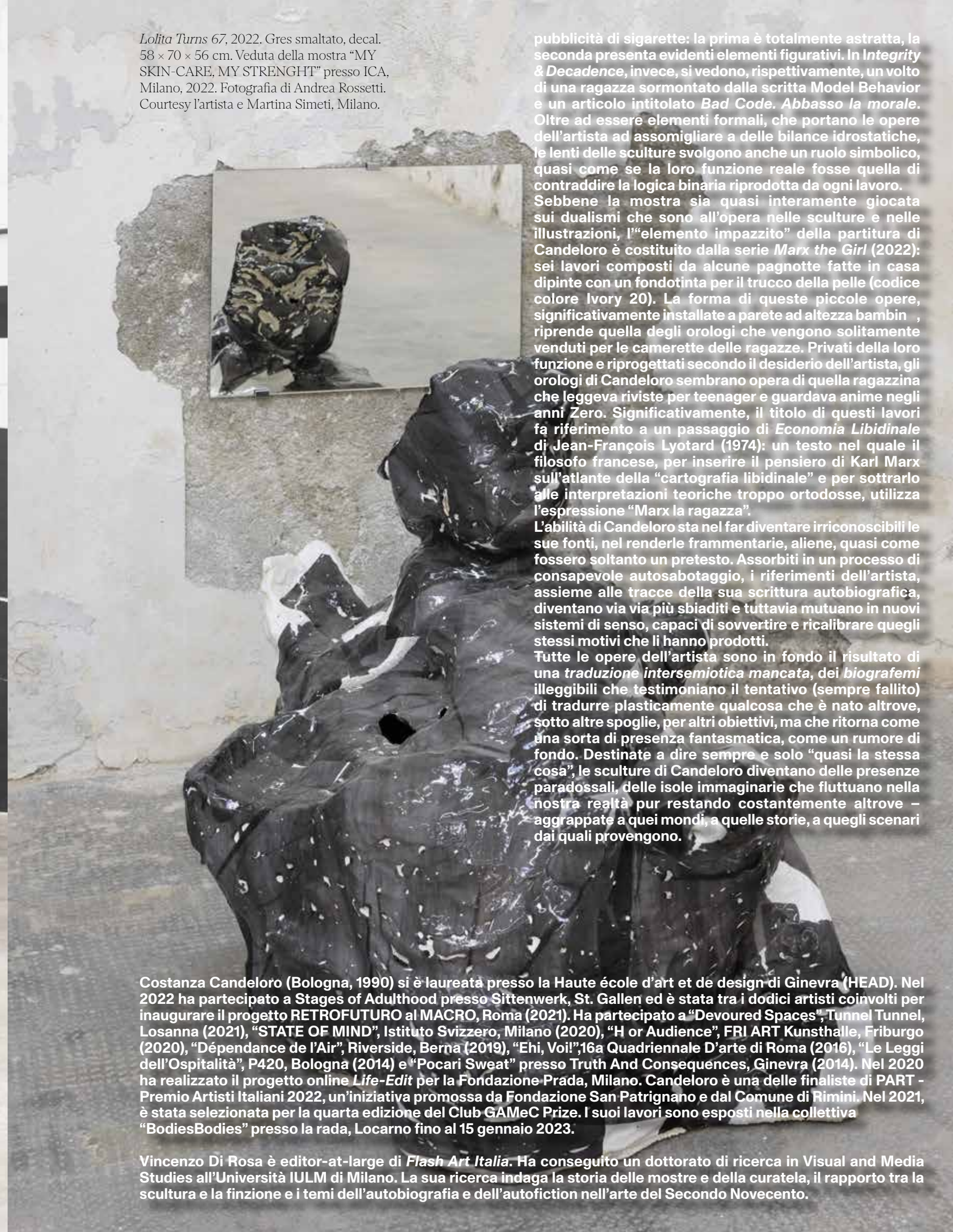
Lolita Turns 67, 2022. Gres smaltato, decal. 58 x 70 x 56 cm. Veduta della mostra "MY SKIN-CARE, MY STRENGTH" presso ICA, Milano, 2022.