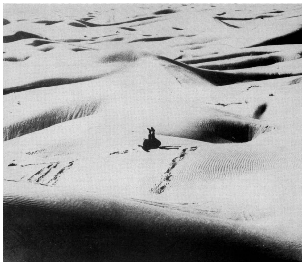
3. Antonio Paradiso, still dal film Anima cartonata , 1975.

mutamento dell'uomo nello spazio e nel tempo». 28 Paradiso considera lo stesso paesaggio come un'opera d'arte. Durante una conversazione che ho avuto con l'artista, nel novembre del 2024, gli ho chiesto quali opere avesse presentato a una mostra del 1981 organizzata nel Sahara, alla Galleria Bidon V, di cui non riuscivo a reperire informazioni. «Non ho esposto nessuna opera», mi ha risposto, «il deserto è già un'opera d'arte». D'altronde, anche dal titolo della pellicola, Sculture filmate antropologiche , risulta chiara l'idea di una scultura che preesiste in quanto forma viva, dinamica, radicata nella natura e nella storia nell'uomo. E forse è questa la differenza più evidente con gli artisti della Land Art, ai quali Paradiso è spesso associato durante la sua carriera, poiché se questi ultimi operano interventi diretti, spesso monumentali, trasformando il paesaggio in maniera radicale, l'artista pugliese lo esplora in quanto entità già scolpita, rivelandone i reperti e le stratificazioni nascoste. 29